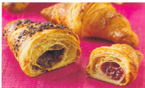
Delizie realizzate con prodotti di DéliFrance Italia

per diverse ore". Con quali formati li proponete? "I formati non sono standard per tutti i prodotti, ma variano per ogni referenza. DéliFrance, infatti, offre